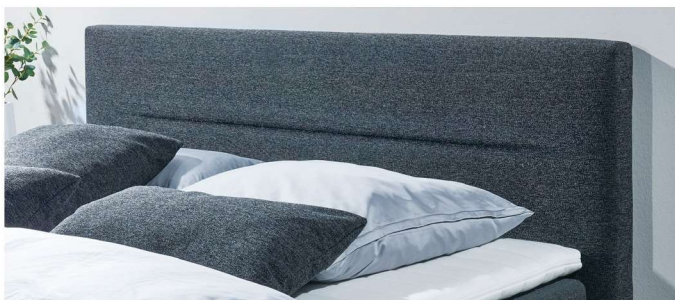
Kopfteil 2, Steppung Linie