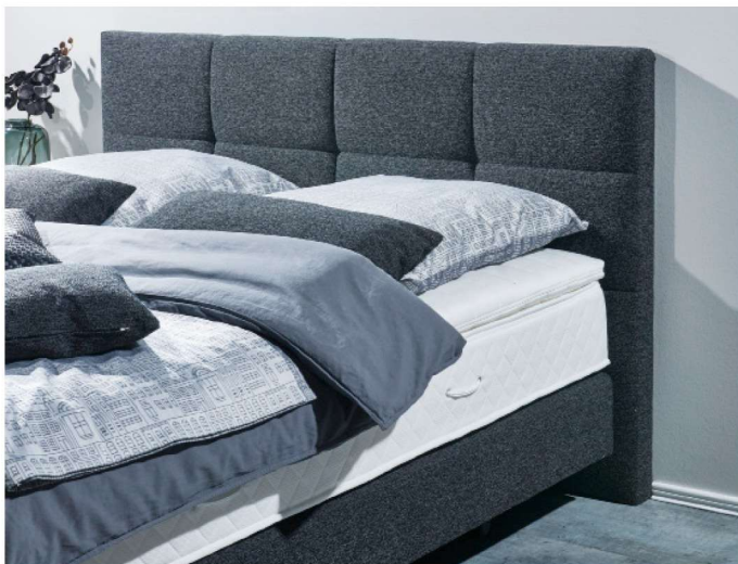
Kopfteil 1, Steppung Rechteck