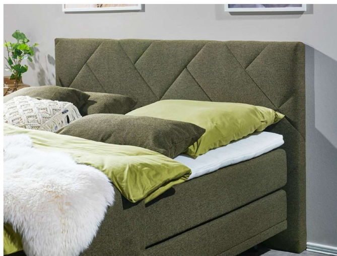
Kopfteil 3, Steppung Kachel

Optional lässt sich das Boxspringbett durch eine Matratze mit 500 Federn / 2 m 2 (T500) oder 800 Federn / 2 m 2 (T800) oder einer Unterfederung mit motorischer Funktion in der Ausstattung anpassen. Möchten Sie die klassische Optik mit einer Matratze im Möbelstoffbezug? Dann Wählen Sie zusätzlich den Möbelstoffbezug aus.