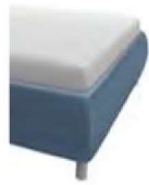
bombiert Höhe ca. 35 cm