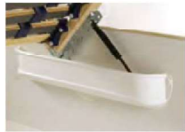
inkl. Luxus-Gasdruckfeder zum Öffnen des Lattenrahmens und Nutzung des Stauraums