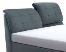
0852KV Höhe 112-123 cm inkl. Kopfteilverstellung mittels Gasdruckfeder gegen Aufpreis