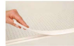
Bettkasten - inkl. Abdeckleiste als Staubschutz