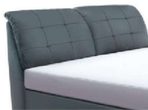
0852 Höhe 112 cm