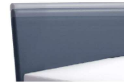
0300 Höhe 55 - 125 cm in 5 cm-Schritten kürzbar gegen Aufpreis