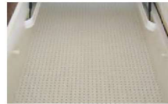
inkl. gelochter Bodenplatte für optimale Luftzirkulation